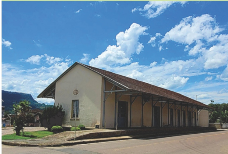
Antiga estação ferroviária no centro de Lontras. Patrimônio restaurado - Foto: Marcelo Frutuoso

Lontras está situado na Região do Alto Vale do Itajaí, distante cerca de 210 quilômetros da capital do Estado, Florianópolis e a 114 quilômetros de Balneário Camboriú.