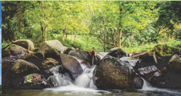
Vila dos Plátanos: Natureza exuberante, ar puro e muito espaço

Assim como o animal que dá nome à cidade, a tímida Lontras, localizada no Alto Vale do Itajaí, está pronta para aparecer e despontar na região. Uma cidade relativamente jovem, repleta de riquezas naturais e culturais, Lontras tem tradição nas suas festas e na culinária, na cultura e arquitetura que despontam nos seus casarões antigos, nas cachoeiras, pontes e igrejas espalhadas pela cidade. São estas as belezas que nos convidam a resgatar, conhecer, cuidar e contar sua história.