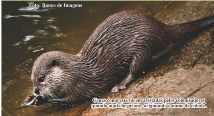
Cenas como esta foram avistadas pelos colonizadores quando aqui chegaram, originando o nome da cidade.