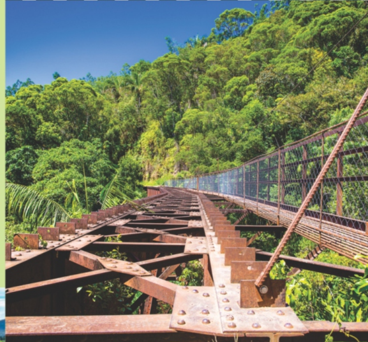
Ponte 16