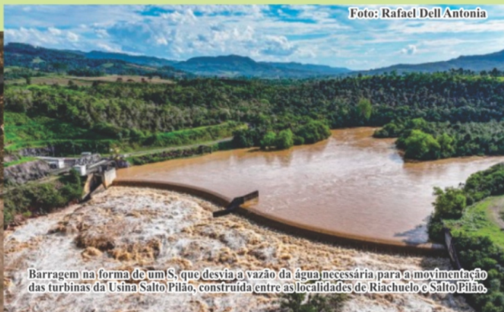
Barragem na forma de um S, que desvia a vazão da água necessária para a movimentação das turbinas da Usina Salto Pilaó, construída entre as localidades de Riachuelo e Salto Pilaó.