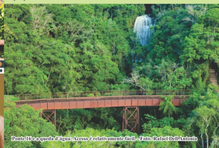
Ponte 16 e a queda d'água: Acesso é relativamente fácil

A estrutura da ponte feita pela empresa Stahlunion, veio da cidade de Dortmund - Alemanha. Sua construção deu-se no ano de 1927, sendo a ponte mais alta existente na serra da Subida, com 27 metros até o ribeirão. O vão é de 50 metros em curva, e proporciona um belíssimo visual.