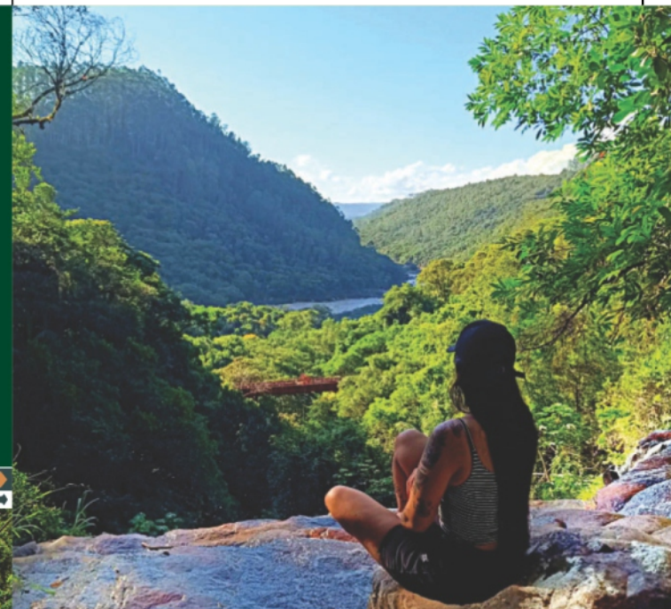
Ponte 16 vista do alto da cachoeira: Visual deslumbrante